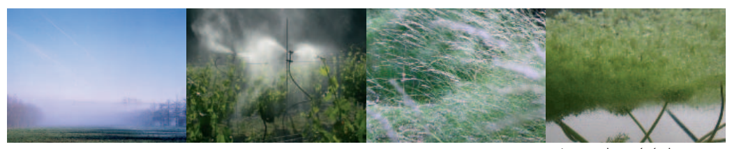
Le complexe végétal vapeurux