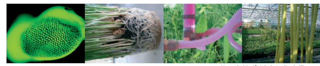
Naturel / Artificiel : le jardin de l'homme

L'amorce Afin de créer un paysage immédiat, nous proposons une forme faite de rubans ajourés posés sur la parcelle. Trois nappes de plastique extrudé ainsi que des brumisateurs sont mis en œuvre sur une structure offrant un support propice au développement d'espèces végétales.